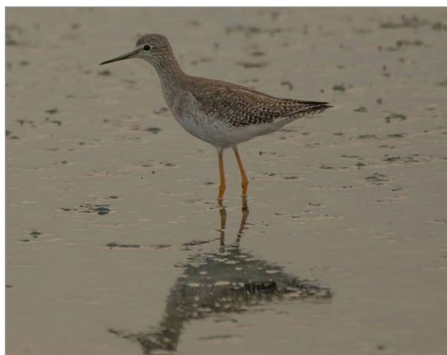
Fig. 4. Totano zampegiale minore Tringa flavipes Comacchio (FE), 10 ottobre 2022.

Nidificazioni: 1 coppia probabilmente nidificante presso il Monte Prinzerà, Terenzo (PR), ad una quota compresa tra i 500 e 700 m s.l.m. (F. Roscelli et al. [O]), sito storico di nidificazione (RAVASINI, 1995). Nel Reggiano una coppia con