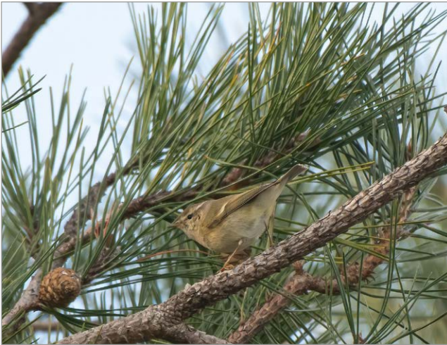
Fig. 5. Lù di Hume Phylloscopus humei Lido Adriano (RA), 3 febbraio 2023.