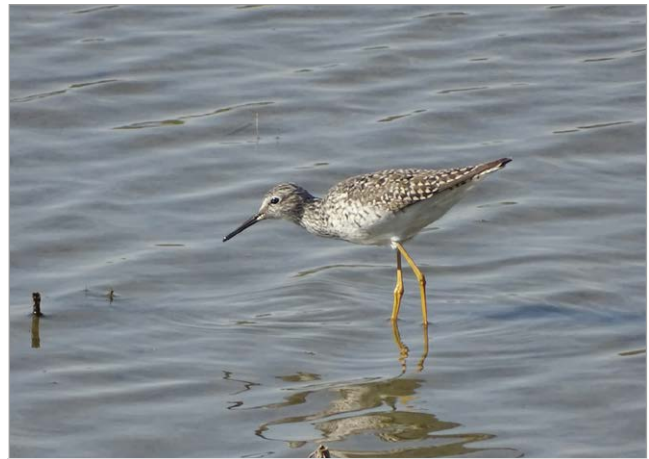
Fig. 3. Totano zampegiale minore Tringa flavipes . Ostellato (FE), 15 aprile 2022.

Annata caratterizzata da numerose osservazioni, specialmente Romagna.