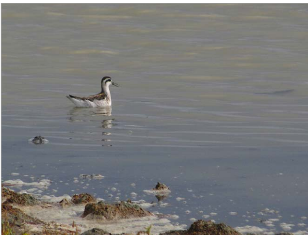
Fig. 2. Falaropo beccosottile Phalaropus lobatus . Vene di Bellocchio (RA), 02 agosto 2022.

1 ind. Vasche Zuccherificio di Ostellato (FE), 15-04/04-05 (M. Cadin, L. Siddi et al. [O][E]; NICOLI, 2022a)*; 1 ind.