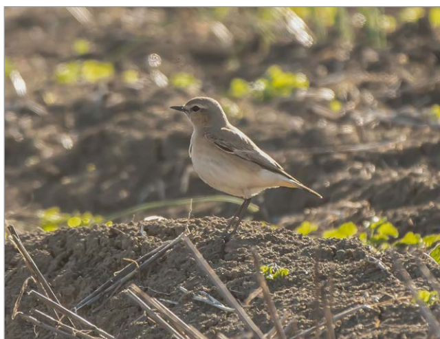
Fig. 6. Culbianco isabellino Oenanthe isabellina Cervia (RA), 10 aprile 2022.