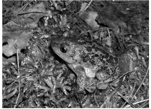
Fig. 1 - Un maschio di Pelobates fuscus proveniente dal Sito di Importanza Comunitaria "Stagni di Poirino Favari".

Fra le specie di anfibi europei che hanno a tal proposito suscitato una maggiore attenzione conservazionistica vi è proprio il pelobate fosco, Pelobates fuscus (Fig. 1). Questo anfibio a vita fossoria e criptica, ampiamente diffuso in tutta Europa, mostra – soprattutto negli ultimi decenni – preoccupanti segni di diminuzione, in particolare lungo i margini occidentali del proprio