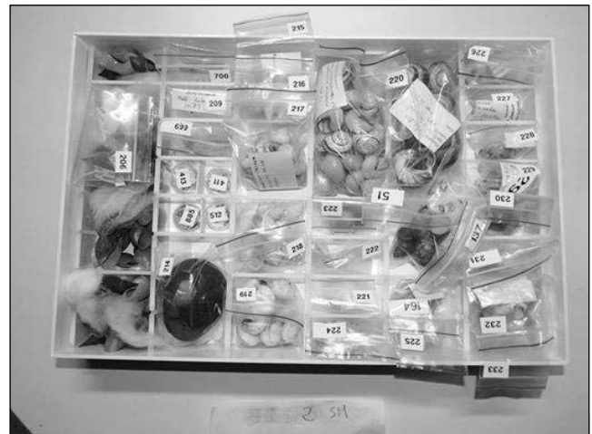
Fig. 1. Una scatola catalogata della collezione malacologica Giorgio Lazzari del Museo di Storia Naturale di Ferrara.

L'inventariazione è tutt'ora in corso e avviene utilizzando un apposito database (Excel), costituito attualmente da 7176 records. Di questi, 315 sono riferibili a specie terrestri e di acque interne raccolte nell'area del Delta del Po e zone limitrofe, prevalentemente in biotopi costieri ravennati (Bassa del Bardello, Punte Alberete, pinete ravennati); 159 records sono inoltre relativi a molluschi terrestri provenienti dai siti selezionati per lo studio (vedi sotto) e da zone limitrofe, che sono stati utilizzati per il confronto con il campionamento attuale.